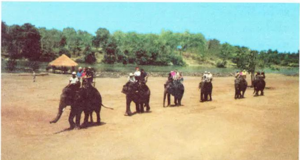
Hình 43.3. Đàn voi chở khách du lịch tại Yok Đôn

Vào mùa đông, các đám nước trong rừng tiếp nhận vô số đàn chim từ phương bắc lạnh bay về cư trú. Vịt trời, ngỗng trời, giang, sếu, le le... đậu la liệt trên các gò đất và trong các bãi lầy. Bằng nhiều chất giọng khác nhau, chúng gọi nhau ríu rít, tạo nên một khung cảnh náo nhiệt lạ thường.