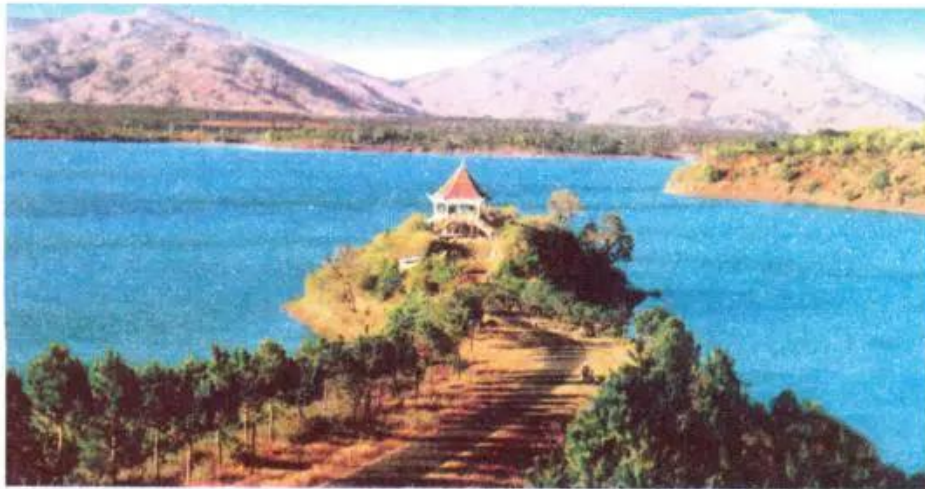
Hình 43.2. Hồ núi lửa Tô-nung (Gia Lai)

Tìm trên hình 43.1 những đỉnh núi cao trên 2000m (Ngọc Linh 2598m, Vọng Phu 2051m, Chư Yang Sin 2405m) và các cao nguyên (Kon Tum, Plây Ku, Đăk Lăk, Lâm Viên, Mơ Nông, Di Linh).