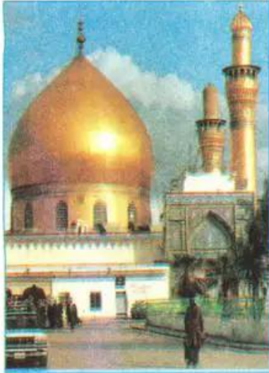
Nhà thờ Hồi giáo