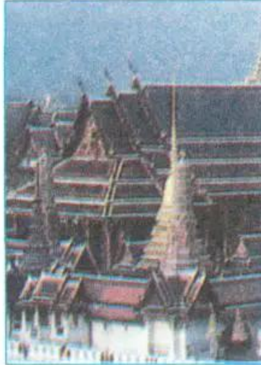
Chùa của Phật giáo