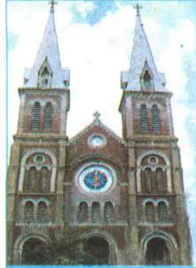
Nhà thờ Ki-tô giáo