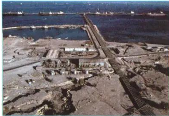
Hình 9.2. Khai thác dầu ở I-ran

Dựa vào hình 9.1, em hãy cho biết các miền địa hình từ đông bắc xuống tây nam của khu vực Tây Nam Á.