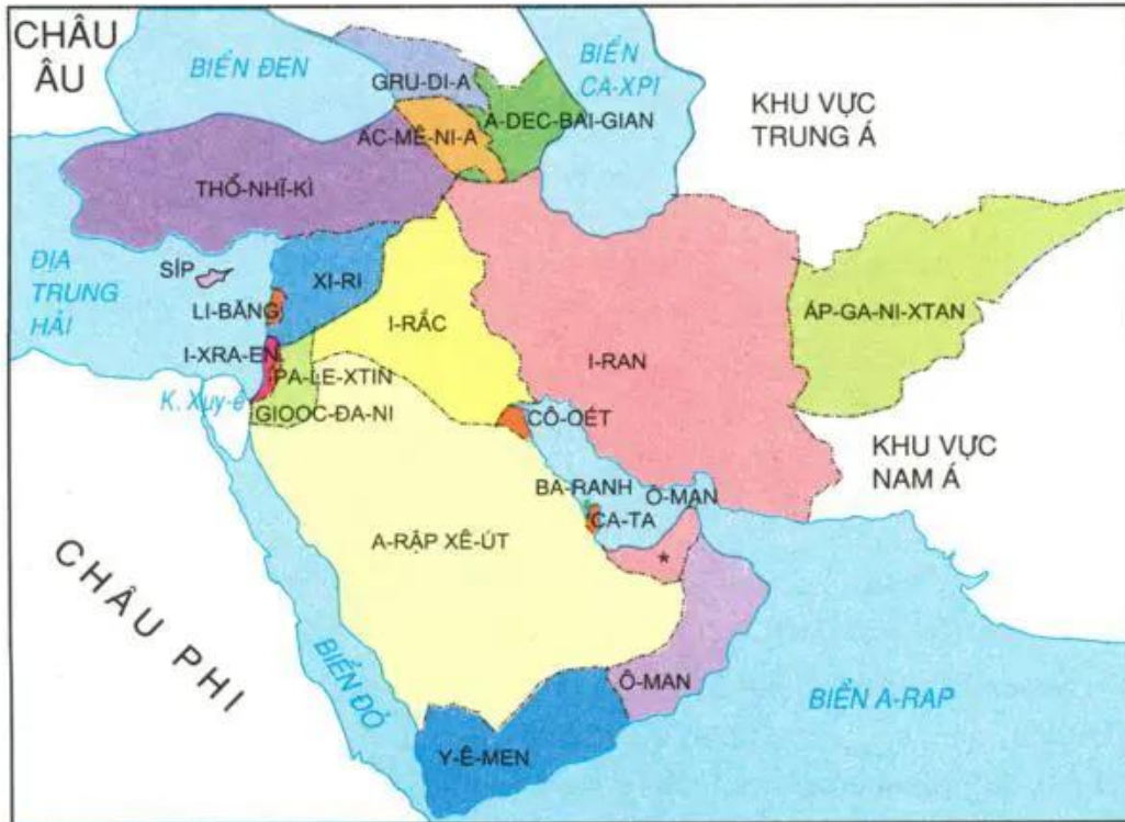
Hình 9.3. Lược đồ các nước khu vực Tây Nam Á (*) Các tiểu vương quốc A-rập thống nhất

Quan sát hình 9.3, em hãy cho biết khu vực Tây Nam Á bao gồm các quốc gia nào? Kể tên quốc gia có diện tích lớn nhất và quốc gia có diện tích nhỏ nhất.