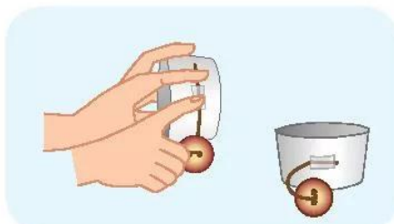
Bước 3: Dùng băng keo dán đầu chỉ còn lại vào mỗi bên chiếc li