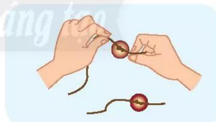
Bước 2: Buộc một đầu chỉ vào mỗi hạt nút áo