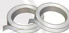
băng keo (băng dính)