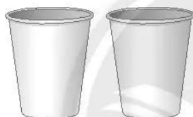
hai chiếc li (cốc) giấy