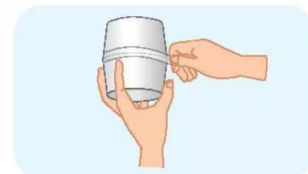
Bước 4: Dùng băng keo dán chặt hai miệng li với nhau