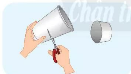
Bước 1: Cắt phần dưới của hai chiếc li