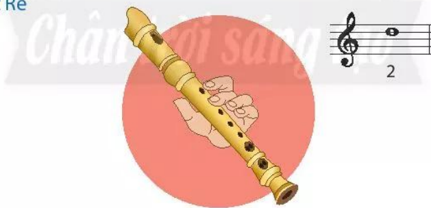
Nốt Rê: Bấm lỗ 2