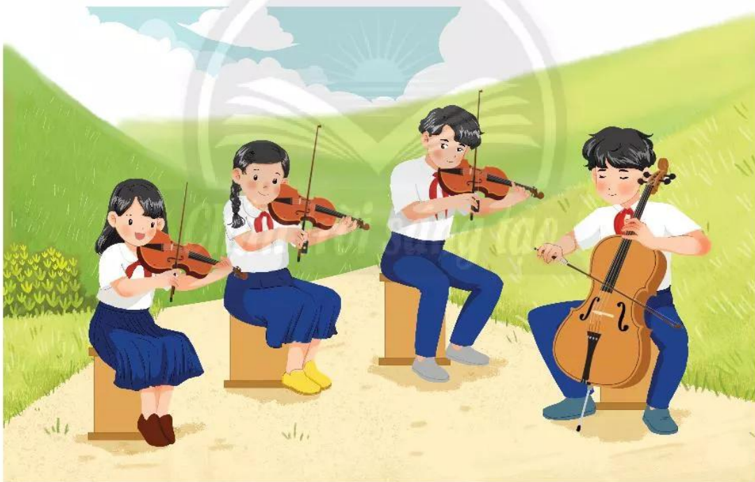
Biểu diễn nhạc cụ dây