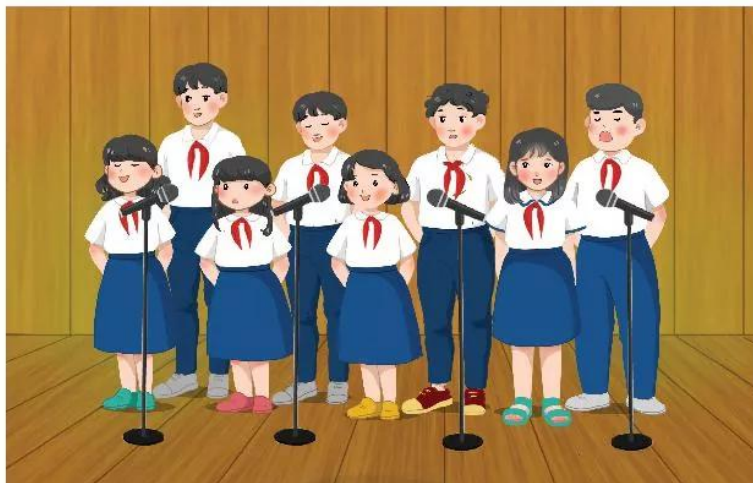
Biểu diễn hát tốp ca