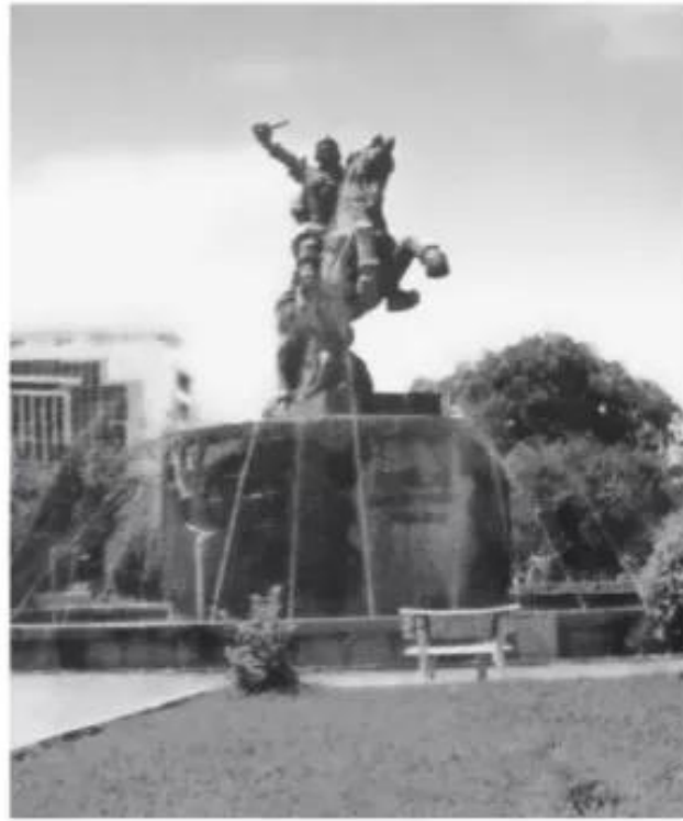
Hình 47 – Tượng Quang Trung (Quy Nhơn – Bình Định)

Năm 1792, vua Quang Trung đột ngột qua đời, triều đình rơi vào tình trạng lục đục, suy yếu dần. Năm 1802, trước sự tấn công của quân Nguyễn Ánh, các vương triều Tây Sơn lần lượt sụp đổ.