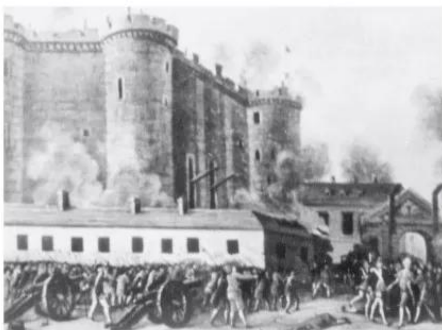
Hình 57 – Tấn công ngục Ba-xi

Bất bình trước hành động của nhà vua, ngày 14 – 7 – 1789, quần chúng nhân dân đã tự vũ trang, tấn công các trụ sở, các cơ quan quan trọng của thành phố và chiếm ngục Ba-xi – biểu tượng của chế độ phong kiến chuyên chế. Cách mạng đã bùng nổ ở Pháp. (1)