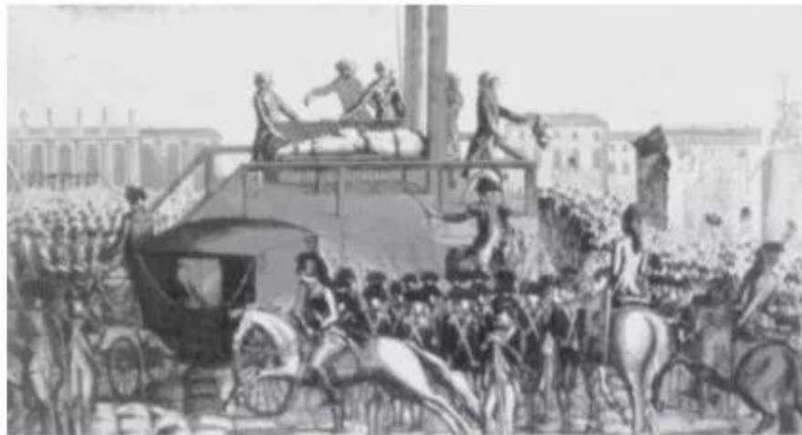
Hình 59 – Vua Lu-i XVI bị xử chém (21 – 1 – 1793)

Đầu năm 1793, nước Pháp đứng trước những thử thách nặng nề. Bên trong, bọn phản cách mạng nổi loạn, đời sống nhân dân sa sút do nạn đói cơ tích trữ và chiến tranh kéo dài, sản xuất bị đình trệ. Bên ngoài, các nước phong kiến châu Âu, được sự hỗ trợ của quân Anh, liên minh với nhau chống lại nền cộng hoà non trẻ.