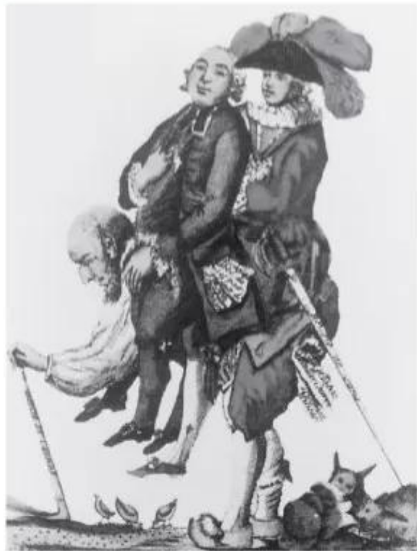
Hình 56 – Tình cảnh nông dân Pháp trước cách mạng

Công thương nghiệp Pháp thời kì này đã phát triển, tập trung ở các vùng ven Địa Trung Hải và Đại Tây Dương.