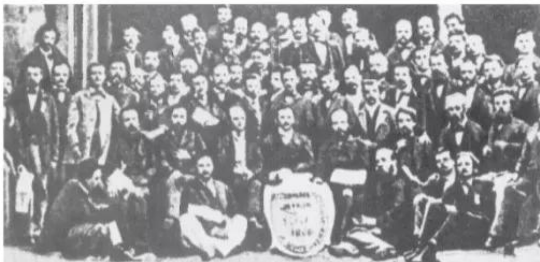
Hình 76 – Cuộc họp đại biểu lần đầu tiên của Quốc tế thứ nhất tại Giơ-ne-vơ

Trong thời gian tồn tại (từ tháng 9 – 1864 đến tháng 7 – 1876), Quốc tế thứ nhất đã tiến hành 5 đại hội. Hoạt động chủ yếu của Quốc tế nhằm truyền bá học thuyết Mác, chống những tư tưởng lệch lạc trong nội bộ ; đồng thời, thông qua những nghị quyết có ý nghĩa chính trị và kinh tế quan trọng : tán thành bãi công, thành lập công đoàn, đấu tranh có tổ chức, đòi ngày làm 8 giờ và cải thiện đời sống công nhân.