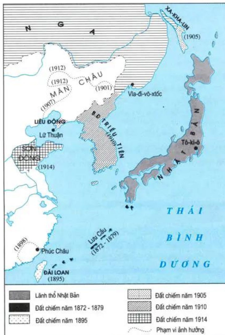
Hình 49. Lược đồ đế quốc Nhật cuối thế kỉ XIX - đầu thế kỉ XX