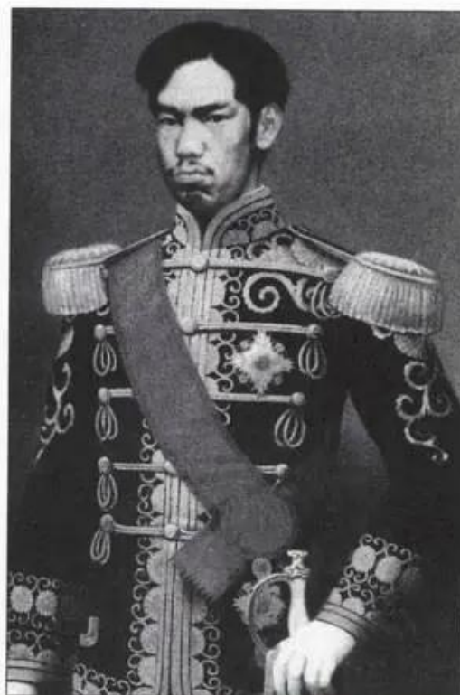
Hình 47. Thiên hoàng Minh Trị (1852 - 1912)

Về quân sự : Quân đội được tổ chức và huấn luyện theo kiểu phương Tây, chế độ nghĩa vụ thay cho chế độ trưng binh. Công nghiệp đóng tàu, sản xuất vũ khí được chú trọng...