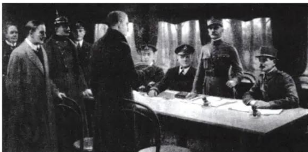
Hình 51. Đức kí hiệp định đầu hàng, kết thúc Chiến tranh thế giới thứ nhất

Ngày 11 - 11 - 1918, chính phủ mới ở Đức đầu hàng không điều kiện. Chiến tranh thế giới kết thúc với sự thất bại hoàn toàn của phe Đức, Áo - Hung.