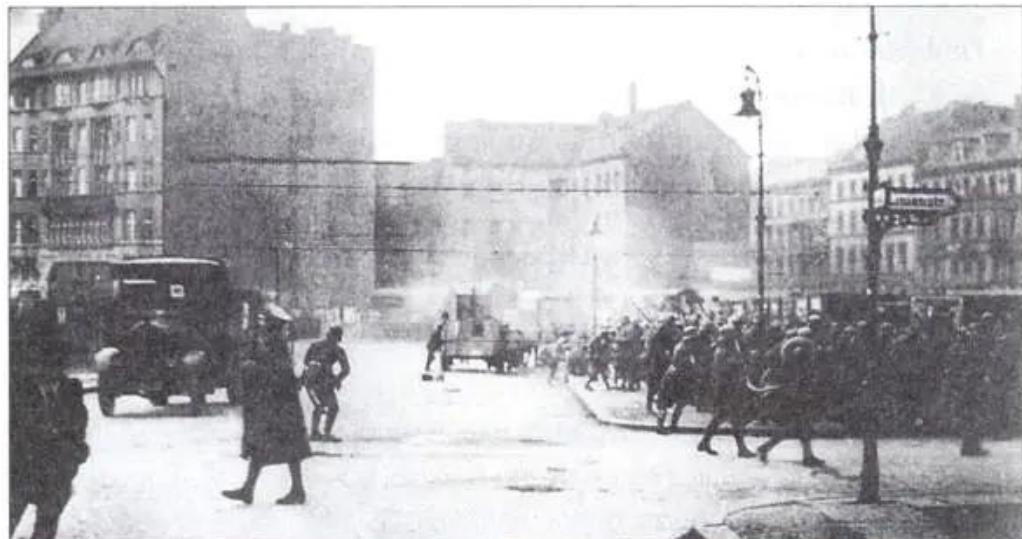
Hình 61. Một đường phố ở Béc-lin trong cao trào cách mạng 1918 - 1923

Trong những năm 1918 - 1923, một cao trào cách mạng đã bùng nổ ở hầu khắp các nước châu Âu, đặc biệt lên cao ở Đức.