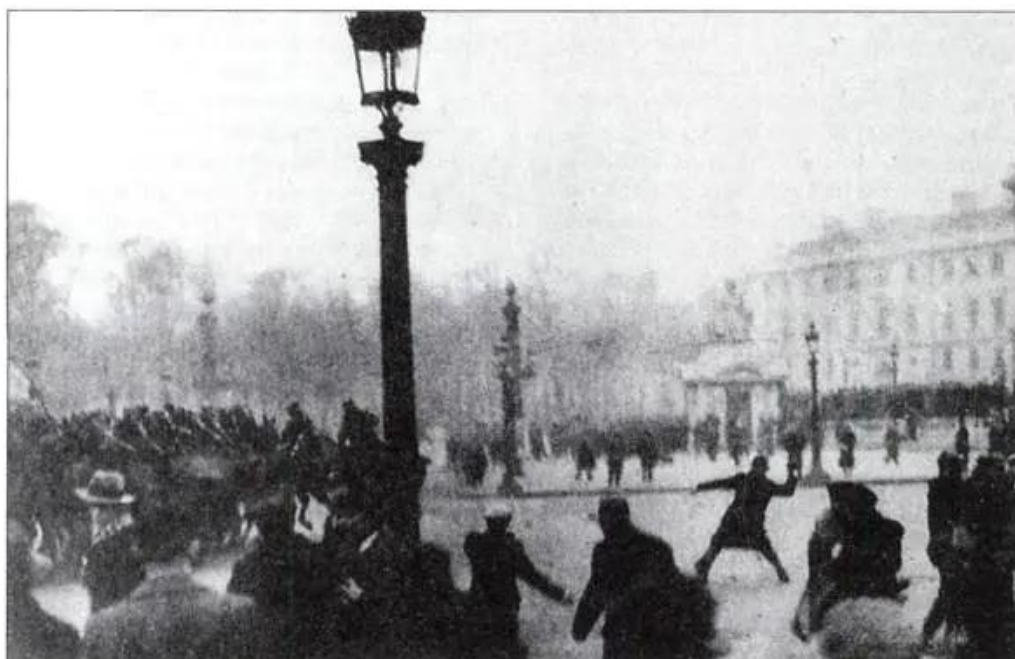
Hình 63. Quảng trường Công-coóc ở Pa-ri ngày 6 - 2 - 1934

Từ năm 1929, trước nguy cơ xuất hiện chủ nghĩa phát xít và chiến tranh thế giới, một cao trào cách mạng lại bùng nổ. Dưới sự chỉ đạo của Quốc tế cộng sản, phong trào đấu tranh thành lập Mặt trận nhân dân chống chủ nghĩa phát xít đã lan rộng ở nhiều nước tư bản châu Âu.