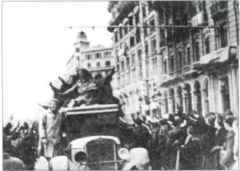
Hình 64. Thắng lợi của Mặt trận nhân dân Tây Ban Nha (tháng 2 - 1936)

Nhờ sự hậu thuẫn của phát xít Đức và I-ta-li-a, các thế lực phát xít Tây Ban Nha tiến hành đảo chính ở nhiều thành phố. Cuộc chiến tranh chống phát xít của nhân dân Tây Ban Nha kéo dài hơn ba năm (1936 - 1939), với sự giúp đỡ của những đội quân tình nguyện đến từ 53 nước trên thế giới, cuối cùng bị thất bại.