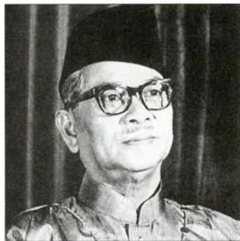
Hình 73. Áp-đun Ra-man (1903 - 1990), lãnh tụ phong trào độc lập dân tộc ở Mã Lai

Cùng với sự phát triển của phong trào vô sản, phong trào dân chủ tư sản cũng có những bước tiến rõ rệt so với những năm đầu thế kỉ XX.