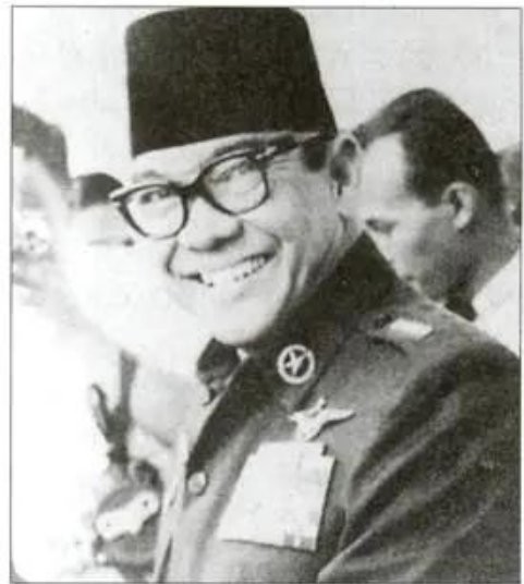
Hình 74. A. Xu-các-nô (1901 - 1970), lãnh tụ phong trào độc lập dân tộc ở In-đô-nê-xi-a

Trong hơn ba thế kỉ dưới sự áp bức, bóc lột tàn tệ của thực dân Hà Lan, nhân dân In-đô-nê-xi-a đã nhiều lần nổi dậy đấu tranh. Trong những năm 1926 - 1927, khởi nghĩa đã bùng nổ ở các đảo Gia-va và Xu-ma-tơ-ra dưới sự lãnh đạo của Đảng Cộng sản. Sau khi khởi nghĩa bị đàn áp, quần chúng đã ngả theo phong trào dân tộc tư sản do Ác-mét Xu-các-nô, lãnh tụ của Đảng Dân tộc, đứng đầu.