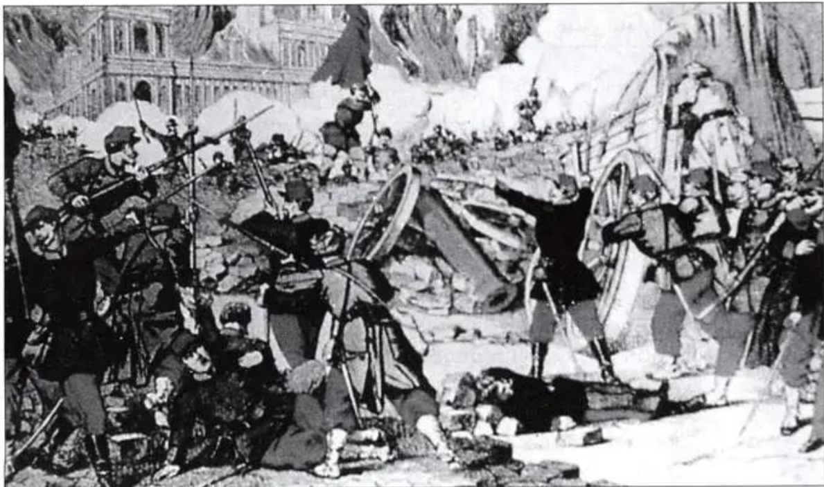
Hình 31. Cuộc chiến đấu trên chiến lũy

Ngày 20 - 5, quân chính phủ Véc-xai bắt đầu tổng tấn công vào thành phố. Từ đó diễn ra cuộc chiến ác liệt giành giật từng ngôi nhà, góc phố, kéo dài cho đến ngày 28 - 5 - 1871, lịch sử gọi là “Tuần lễ đẫm máu”. Nhân dân lao động Pa-ri, kể cả người già, phụ nữ, trẻ em đều tham gia chiến đấu. Trận chiến đấu cuối cùng của các chiến sĩ Công xã diễn ra ở nghĩa địa Cha La-se-dơ ngày 27 - 5.