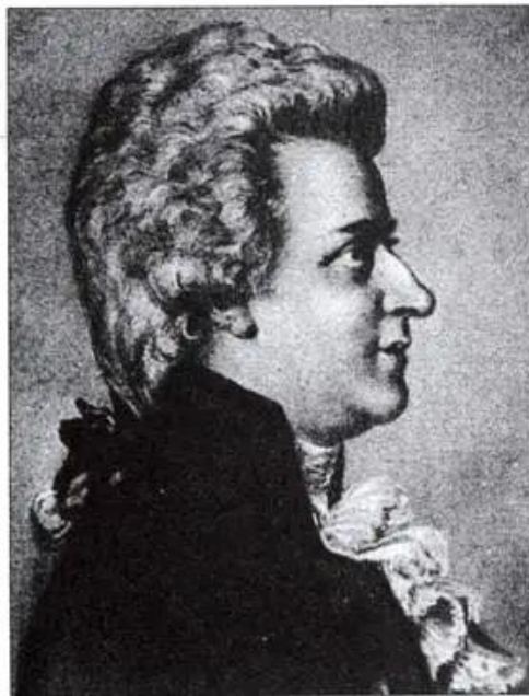
Hình 39. V.A. Mô-da (1756 - 1791)

Chủ nghĩa hiện thực phê phán xuất hiện và trở thành trào lưu văn học tiến bộ. Tiêu biểu là các nhà văn : Ban-dắc ở Pháp, Thác-ca-rê, Đích-ken ở Anh, Gô-gôn, Lép Tôn-xtôi ở Nga...