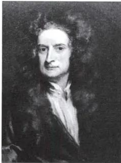
Hình 38. I. Niu-tơn (1643 - 1727)

Năm 1859, nhà bác học Đác-uyn (Anh) nêu lên thuyết tiến hoá và di truyền. Học thuyết của Đác-uyn đập tan quan niệm về nguồn gốc thần thánh của sinh vật và về tính chất bất biến của các loài.