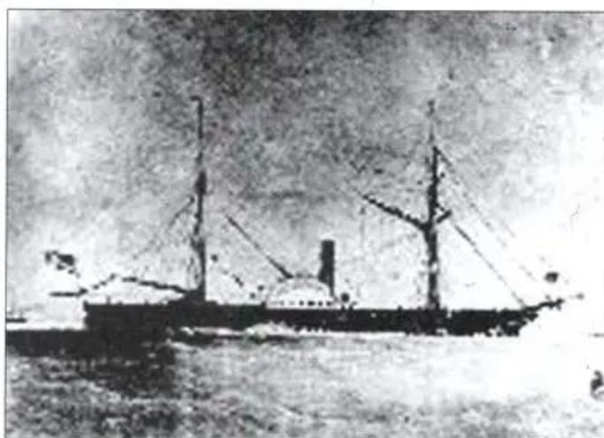
Hình 37. Tàu thuỷ Phơn-tơn

Việc phát minh ra máy hơi nước cũng làm cho ngành giao thông vận tải tiến bộ nhanh chóng.