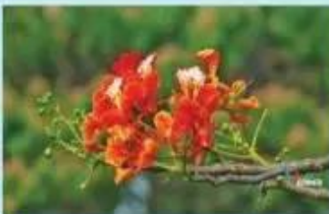
Hoa phượng vĩ