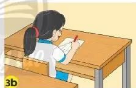
3b Vẽ cơ quan thần kinh lên hình người