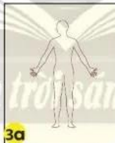
3a Vẽ hình người lên giấy