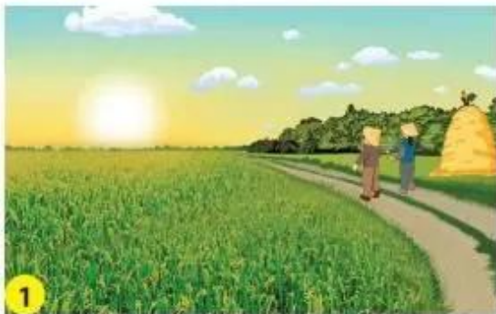
1 Buổi sáng, Mặt Trời mọc ở phương đông.