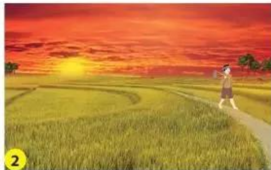
2 Buổi chiều, Mặt Trời lặn ở phương tây.