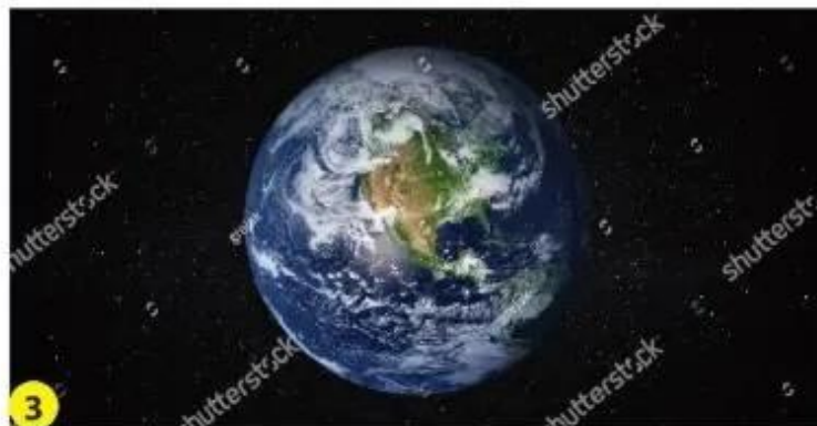
Ảnh chụp Trái Đất từ vệ tinh.