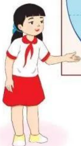
Lược đồ các châu lục và đại dương