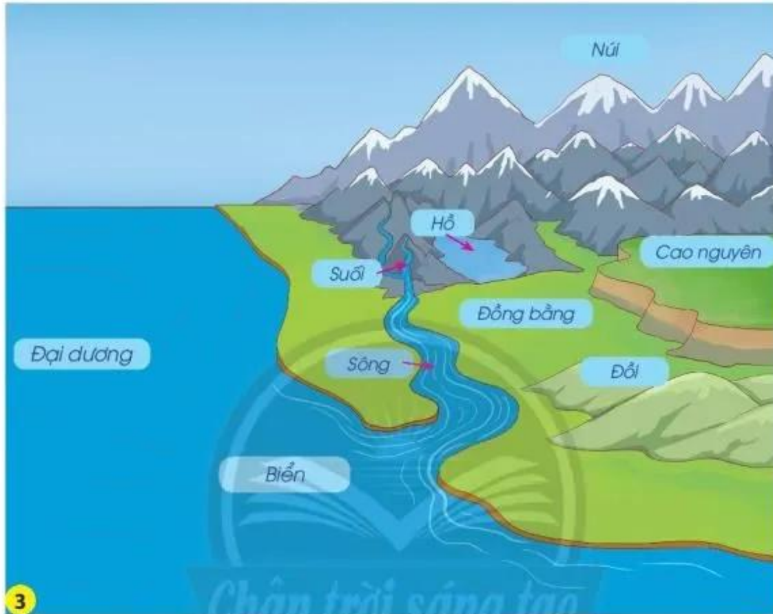
Sơ đồ các dạng địa hình trên bề mặt Trái Đất