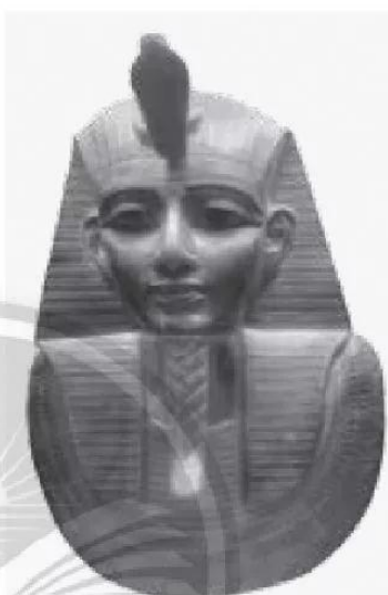
Mặt nạ vua Tu-tan-kha-mun

Nửa thế kỉ trôi qua, vào năm 2005, máy chụp cắt lớp CT Scan của y khoa hiện đại chụp ra 1700 hình ảnh từ xác ướp, giúp phục dựng lại khá chính xác khuôn mặt vua Tu-tan-kha-mun, phát hiện thêm bàn chân bên trái bị gãy rất nặng và bị nhiễm trùng trước khi chết.