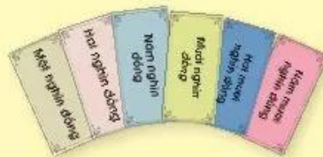
Các thẻ tiền