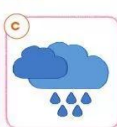
Thời tiết xấu