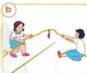
Một bên thả tay