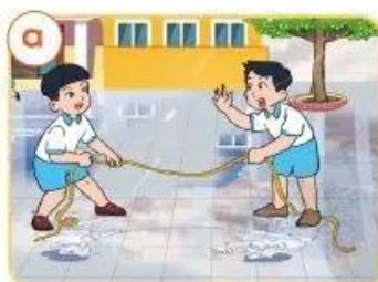
Sân chơi trơn trượt