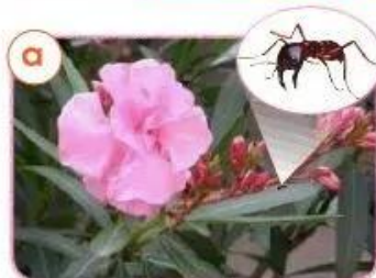
Cây, con vật có chất độc