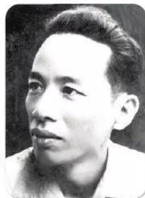
Minh Huệ (1927 – 2003), quê ở Nghệ An