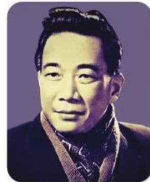
Tố Hữu (1920 – 2002), quê ở Thừa Thiên Huế