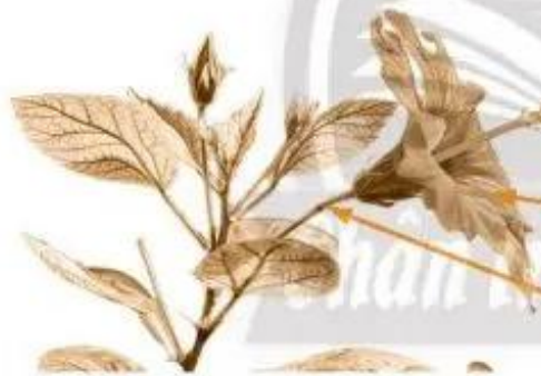
Hoa râm bụt