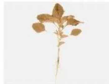
Cây rau dền đỏ