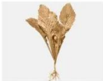
Cây rau cải