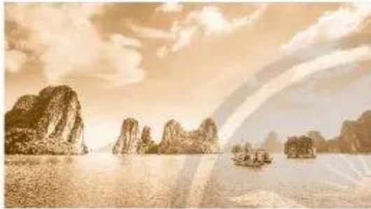
Vịnh Hạ Long (Quảng Ninh)