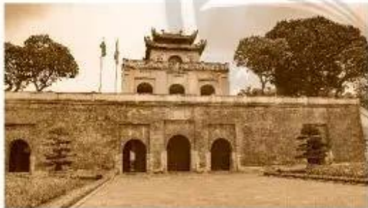
Hoàng thành Thăng Long (Hà Nội)