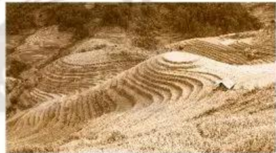
Ruộng bậc thang (Hà Giang)