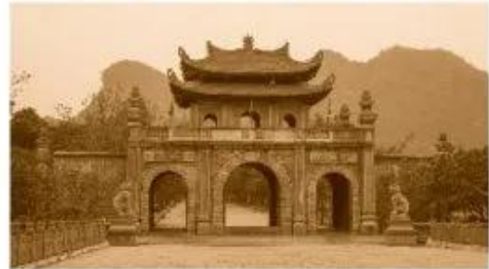
Cố đô Hoa Lư (Ninh Bình)