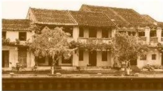
Phố cổ Hội An (Quảng Nam)