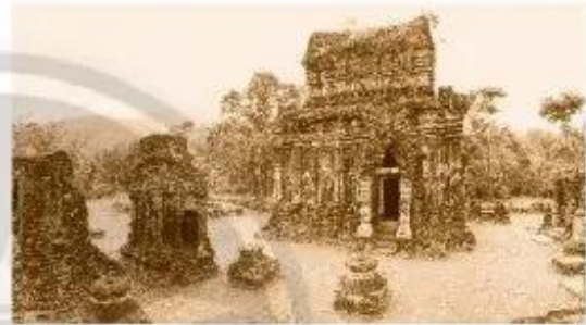
Thánh địa Mỹ Sơn (Quảng Nam)