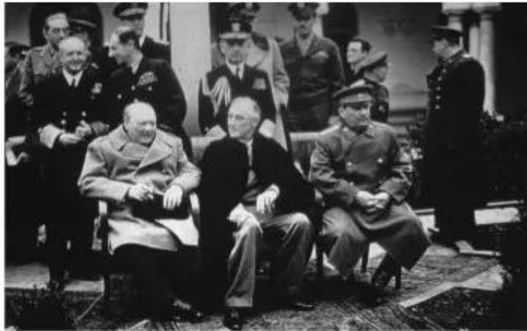
Hình 1. Thủ tướng Anh – U. Sôcsin, Tổng thống Mĩ – Ph. Rudoven, Chủ tịch Hội đồng Bộ trưởng Liên Xô – I. Xtalin (từ trái sang phải) tại Hội nghị Ianta

Hội nghị đã đưa ra những quyết định quan trọng :