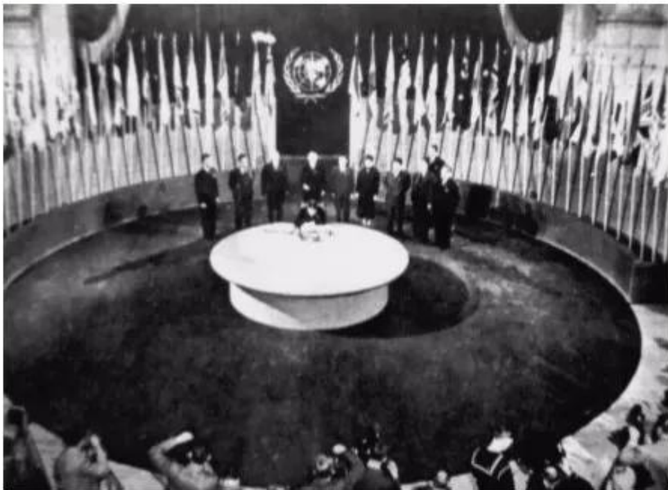
Hình 2. Lễ kí Hiến chương Liên hợp quốc tại Xan Phranxixcô (Mĩ)

Sau Hội nghị Ianta không lâu, từ ngày 25 – 4 đến ngày 26 – 6 – 1945, một hội nghị quốc tế họp tại Xan Phranxixcô (Mĩ) với sự tham gia của đại biểu 50 nước, để thông qua bản Hiến chương và tuyên bố thành lập tổ chức Liên hợp quốc . Ngày 24 – 10 – 1945, sau khi được Quốc hội các nước thành viên phê chuẩn, bản Hiến chương chính thức có hiệu lực (1) .