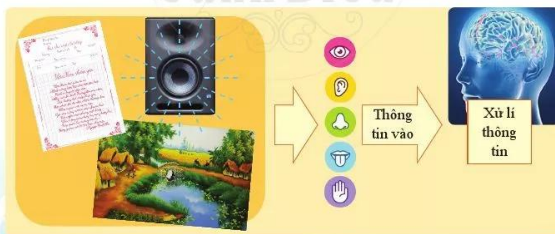
Hình 1. Thu nhận thông tin và xử lí thông tin

Xem ti vi, biết Hà Nội có Hồ Gươm và cầu Thê Húc rất đẹp, em nói với mẹ: “Hè này mẹ cho con đi chơi Hà Nội nhé!”. Nghe dự báo thời tiết, biết ngày mai sẽ có mưa, em nhớ để sáng mai mang theo áo mưa khi đi học. Người đi đường dừng xe lại khi nhìn thấy đèn giao thông có màu đỏ. Đây là các hành động sau khi nhận được thông tin và xử lí thông tin. Hình 1 minh họa sự thu nhận thông tin để xử lí thông tin của con người.