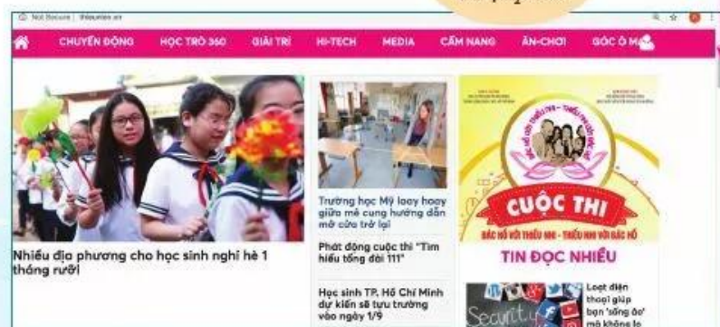
Hình 1. Theo trang web báo Thiếu niên Tiền phong, ngày 28/6/2020