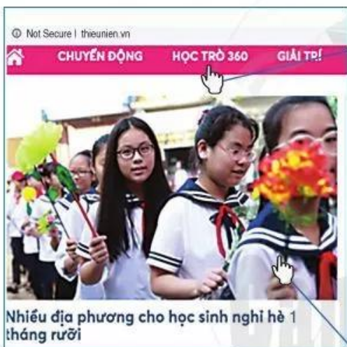
Hình 2. Theo trang chủ của website báo Thiếu niên Tiền phong, ngày 28/6/2020

Website: tập hợp các trang web (web pages) có liên quan đến nhau và được gắn cùng một địa chỉ.