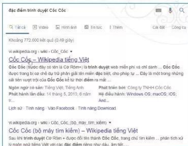
Hình 2a. Kết quả tìm với từ khoá “đặc điểm trình duyệt Cốc Cốc”

Ví dụ: Tìm kiếm với từ khoá “đặc điểm trình duyệt Cốc Cốc” trên Google.