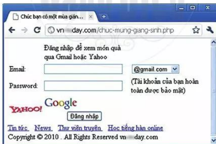
Hình 2. Một trang web lừa đảo

Em hãy dự đoán đâu là những thông điệp quảng cáo hoặc mang nội dung xấu trong các email ở Hình 1 và Hình 2 ở trên.