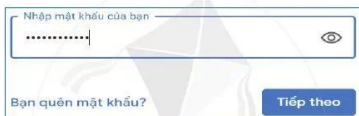
Hình 3. Đăng nhập trong chế độ ẩn mật khẩu

Em hãy thực hiện thao tác đăng nhập trong chế độ ẩn mật khẩu (Hình 3).