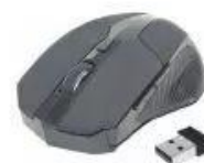
Hình 2. Chuột không dây và USB Receiver

1) Chuột không dây có một bộ phận rời gọi là USB Receiver (Hình 2), có chức năng kết nối chuột với máy tính. Em hãy cắm bộ phận này vào cổng USB của máy tính để sử dụng chuột không dây. Hãy cho biết USB Receiver giúp máy tính kết nối với chuột qua sóng điện từ hay cáp mạng.