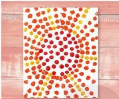
Chấm màu, tranh màu a-cô-ry-lic, Đặng Thu Trà

Quan sát các hình dưới đây và cùng nhau trao đổi về cách sắp xếp các chấm màu.