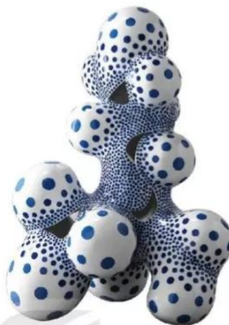
Dấu chấm màu xanh, điêu khắc sứ, Ha-ru-mi Na-ca-si-ma