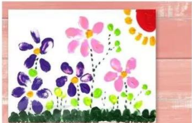
Bông hoa, tranh màu a-cô-ry-lic, Võ Mai Khôi

Có phải các chấm màu đỏ được sắp xếp liên tiếp không?