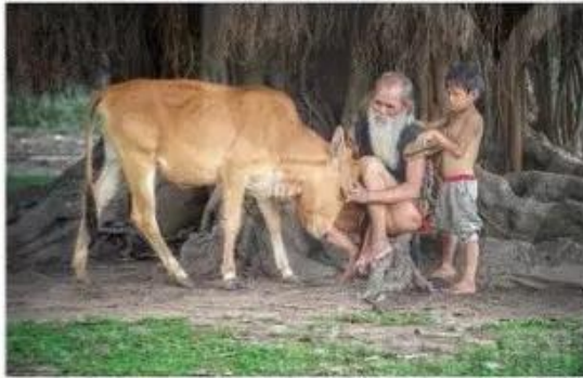
Ông cháu, đồng bào dân tộc Ba-na

1 Hình ảnh về người thân qua một số bức ảnh