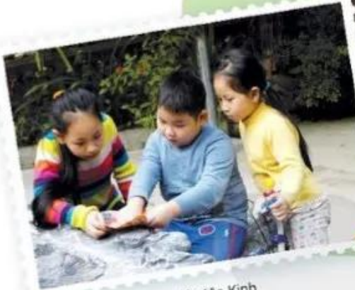
Chị em, đồng bào dân tộc Kinh