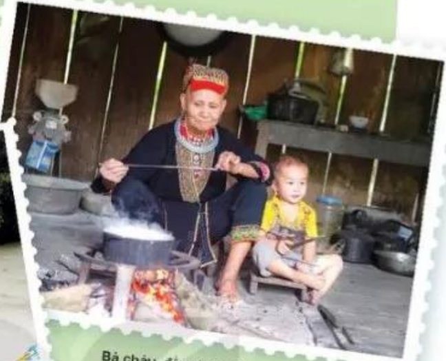
Bà châu, đồng bào dân tộc Dao