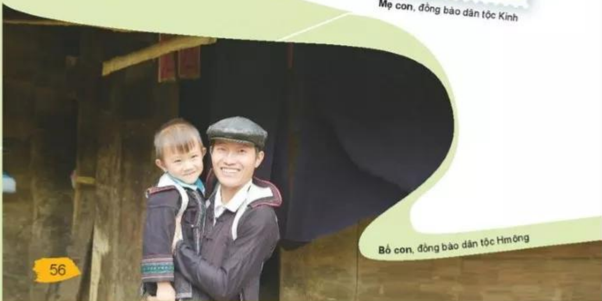
Bố con, đồng bào dân tộc Hmông