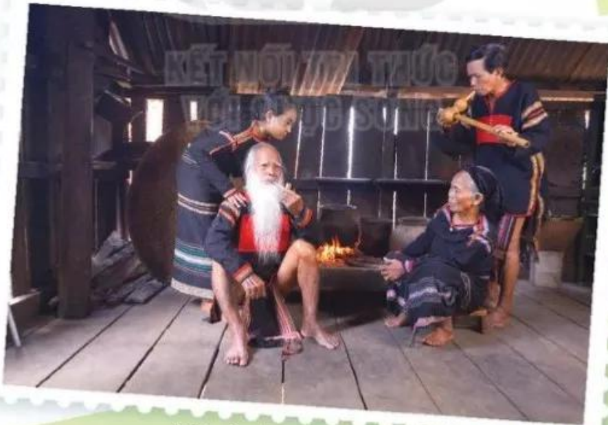
Quầy quán, đồng bào dân tộc Ê-đê