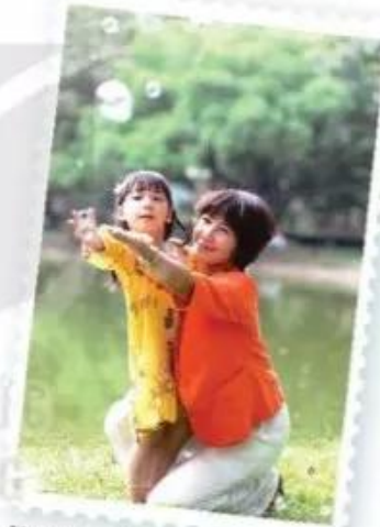
Mẹ con, đồng bào dân tộc Kinh