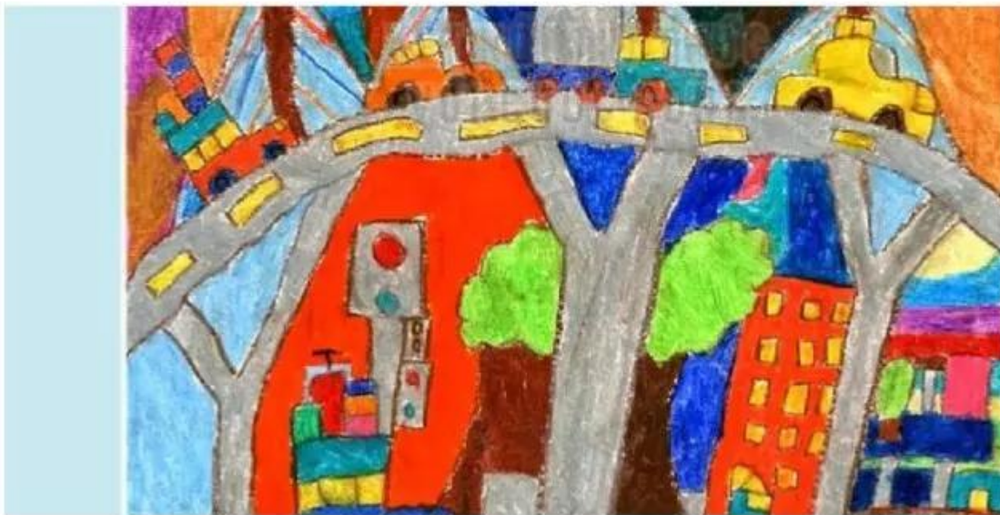
Cầu vượt, tranh sấp màu, Nguyễn Huy Tùng