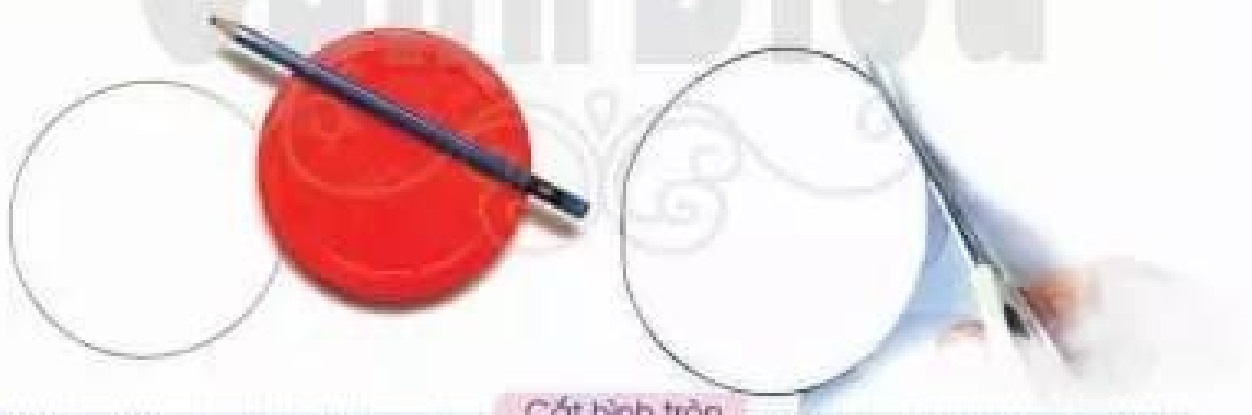
Cắt hình tròn