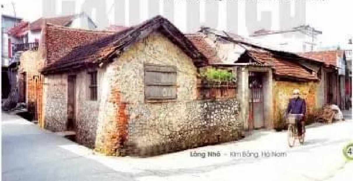
Làng Nhỏ – Kim Bảng, Hà Nam