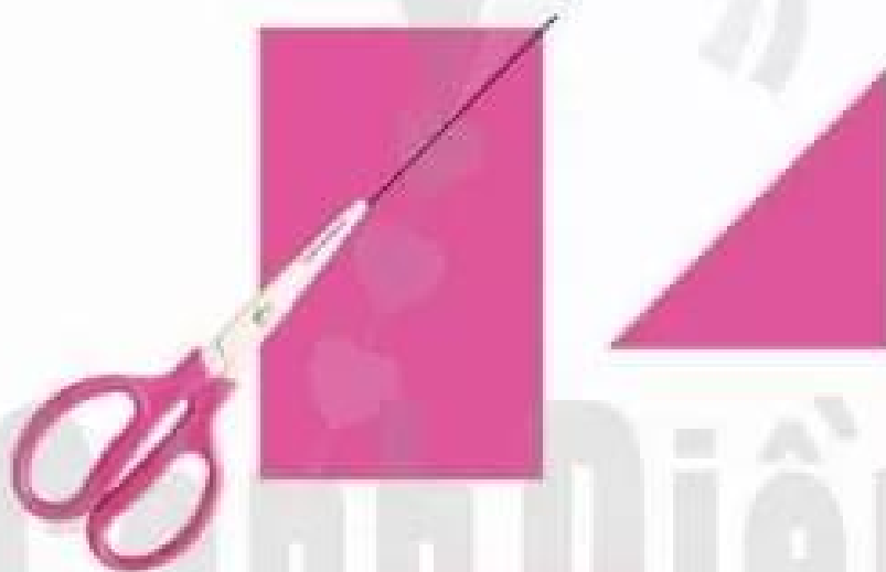
Cắt hình tam giác