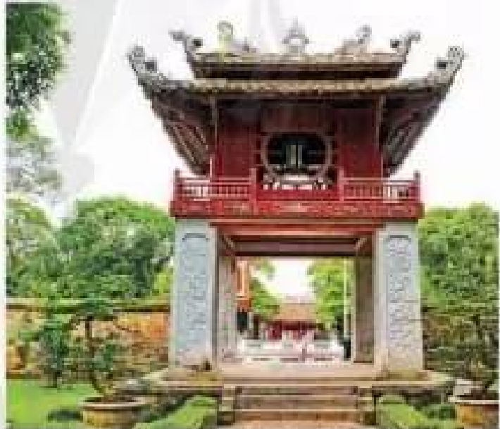
Khuê Văn Các trong Văn Miếu Quốc Tử Giám – Hà Nội