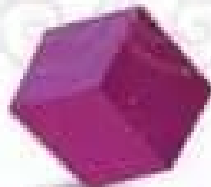
Khối lập phương