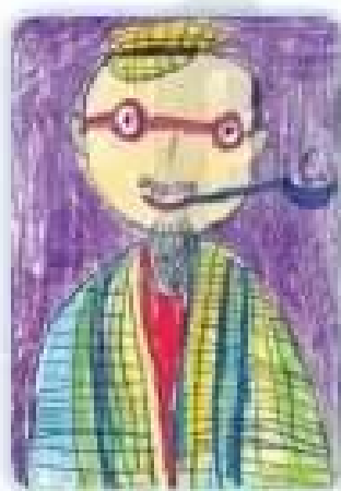
Ông nội – Tranh bột chỉ màu của Lê Tuấn Kiệt

Em có thể vẽ nhiều khuôn mặt của người thân vào một bức tranh.