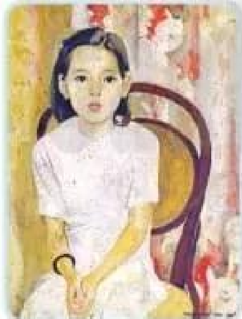
Em Thuý Tranh sơn dầu của họa sĩ Trần Văn Cẩn

Em hãy quan sát và gọi tên một số màu sắc trong những bức tranh chân dung dưới đây: