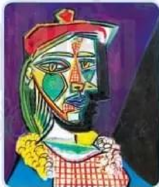
Người đàn bà đội mũ nổi, mặc váy kẻ ô Tranh sơn dầu của họa sĩ Pi-cát-xô