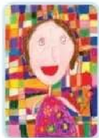
Em gái Tranh màu sáp của Quang Vinh