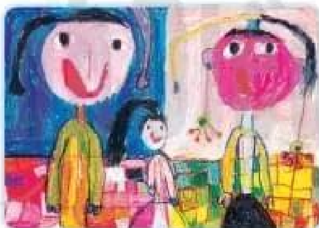
Hai chị em – Tranh màu sáp của Quỳnh Anh

Màu sắc làm cho tranh chân dung hấp dẫn hơn.