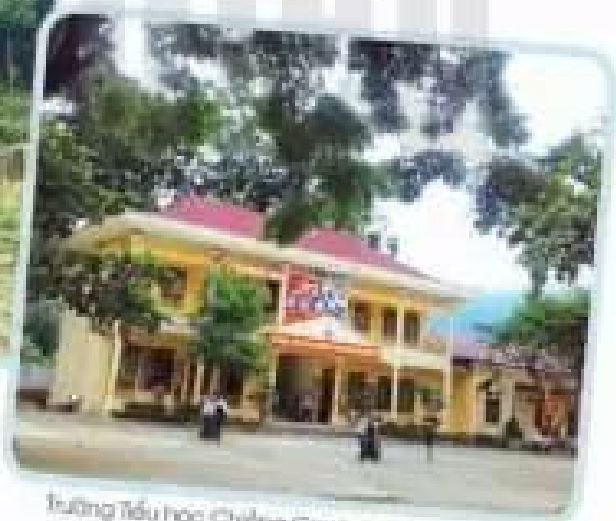
Trường Tiểu học Chiềng Càng, huyện Sông Mã, tỉnh Sơn La