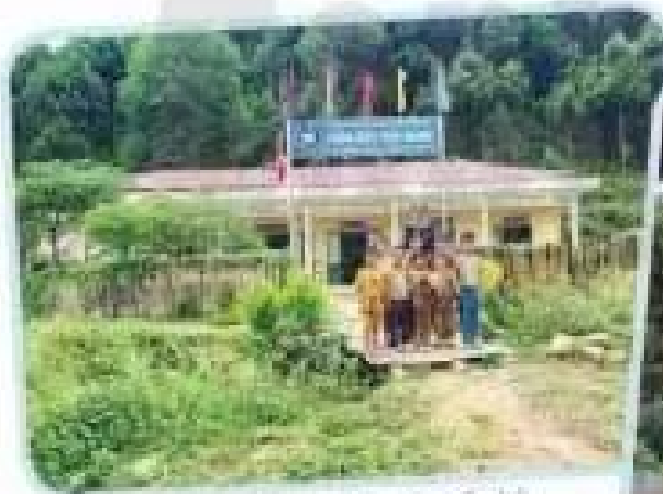
Trường Phổ thông Dân tộc bán trú Tiểu học Năm Lửa 3

Hai ngôi trường dưới đây có gì khác nhau?