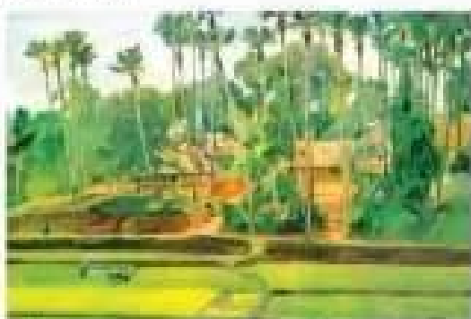
Đài cạ - Tranh màu bột của họa sĩ Lương Xuân Nhị

Em nhìn thấy những hình ảnh thiên nhiên nào trong các bức tranh dưới đây?