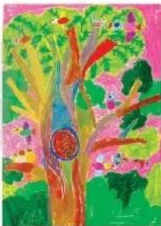
Trong rừng - Tranh màu sáp của Lợi Khánh Linh