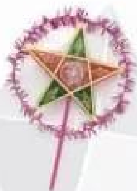
Đèn ông sao