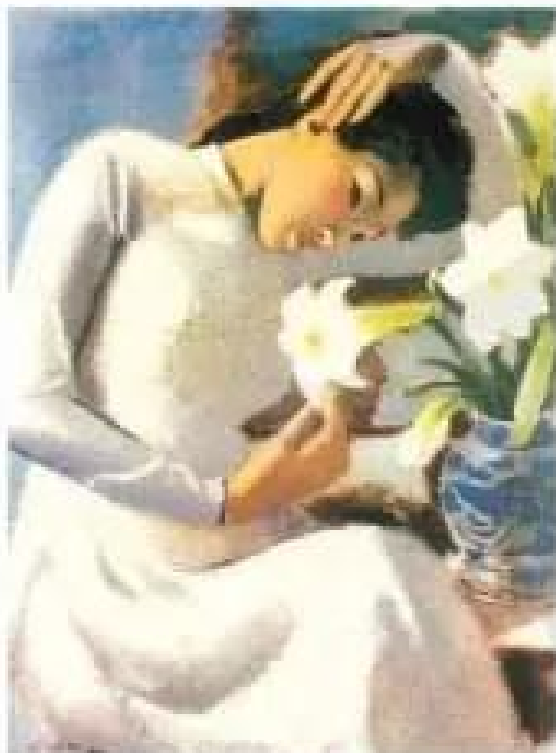
Thiếu nữ bên hoa huệ Tranh sơn dầu của họa sĩ Tô Ngọc Vân