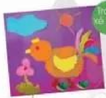
Tranh vẽ dán