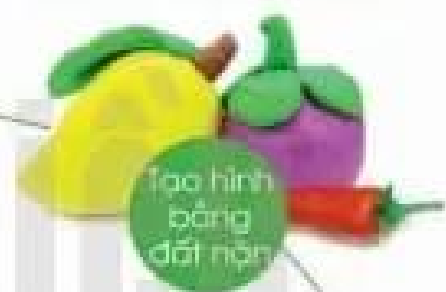
Tạo hình bằng đất nặn