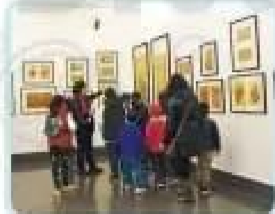
Thăm Bảo tàng Mĩ thuật