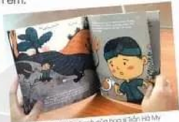
Mình họa truyện tranh của họa sĩ Trần Hà My