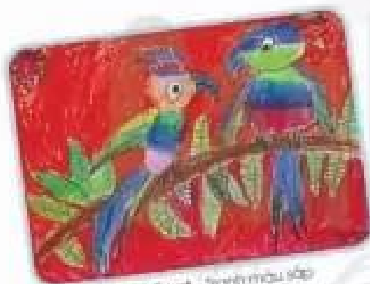
Hai chú vẹt - tranh màu sáp của Dương Trung Nghĩa

Những sản phẩm, tác phẩm mỹ thuật dưới đây thường dùng để làm gì?