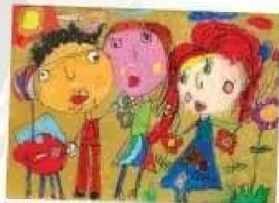
Tranh chân dung - Tranh bút chì màu của Bảo Hòa