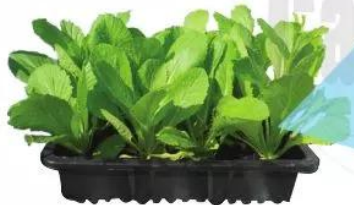
Cây rau cải