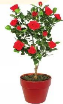
Cây hoa hồng