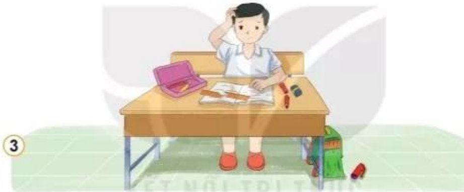
3 Mạnh hay làm rơi bút và thước.