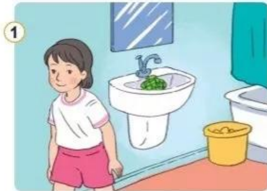
1 Lan thường vo tròn khăn mỗi khi rửa mặt xong.