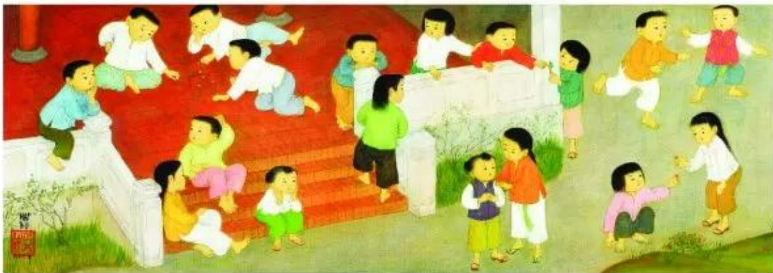
Niềm vui sống, tranh lụa, 1963