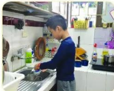
Rửa bát