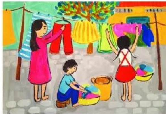
Giúp mẹ, sản phẩm mỹ thuật từ màu bột, Ngô Thu Trà