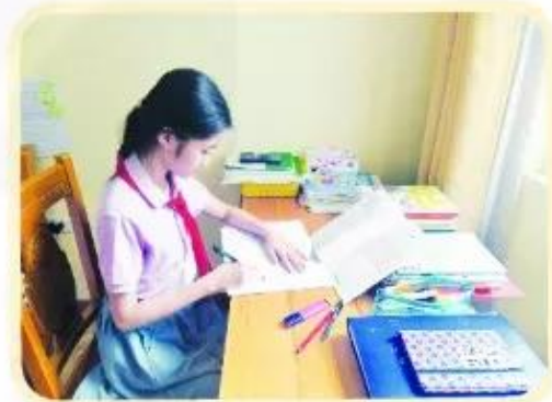
Ôn bài