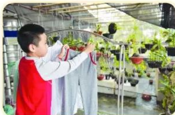
Phơi quần áo