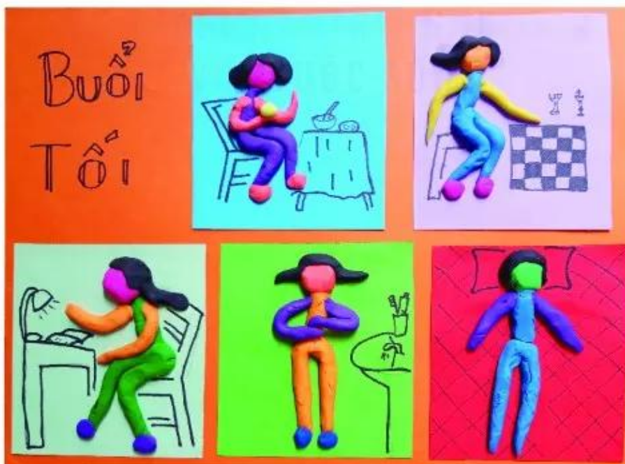
Lịch trong ngày, sản phẩm mỹ thuật từ đất nặn, Trịnh Trà My