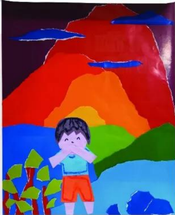
Sản phẩm mỹ thuật trang trí túi đựng bài mỹ thuật, Mai Bá Huỳnh

Sử dụng các hình ảnh cuộc sống thường ngày để trang trí một đồ dùng học tập mà em yêu thích