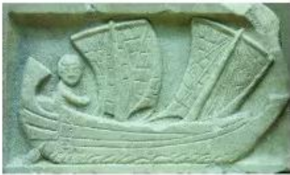
Phù điêu trên đá của nền văn minh Lương Hà, có niên đại khoảng 1186 đến 1172 năm trước Công nguyên