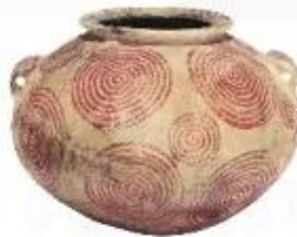
Bình gốm của nền văn minh Ai Cập cổ đại, có niên đại khoảng 3400 đến 3000 năm trước Công nguyên