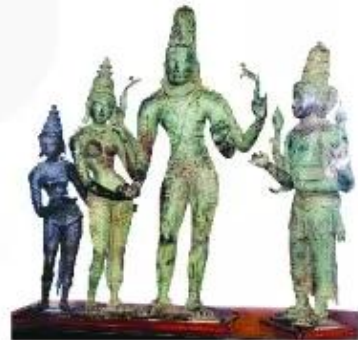
Tượng đồng của nền văn minh Ấn Độ cổ đại, có niên đại khoảng năm 850 đến năm 1250