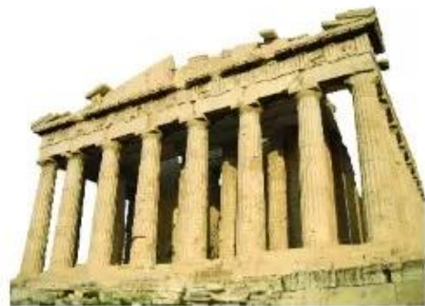
Ngôi đền thờ thần Athena của nền văn minh Hi Lạp cổ đại, có niên đại khoảng 500 năm trước Công nguyên