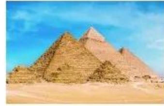
Kim tự tháp Ai Cập

Các bước thực hiện sản phẩm mỹ thuật có khai thác giá trị tạo hình của mỹ thuật thế giới thời kì Cổ đại