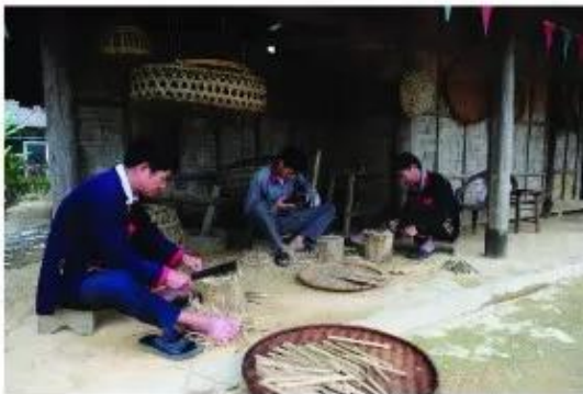
Nghề làm đũa