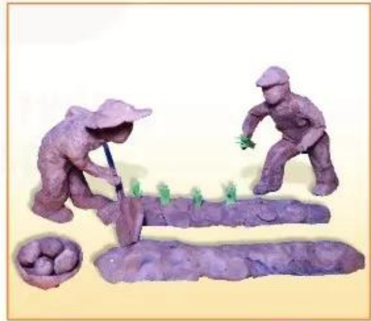
Trồng cây, sản phẩm mỹ thuật từ đất sét, Đoàn Mai Trang