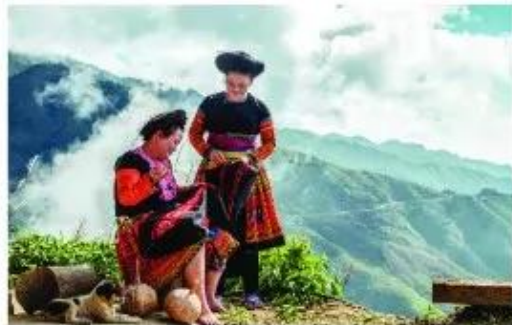
Thêu thổ cẩm, Lào Cai