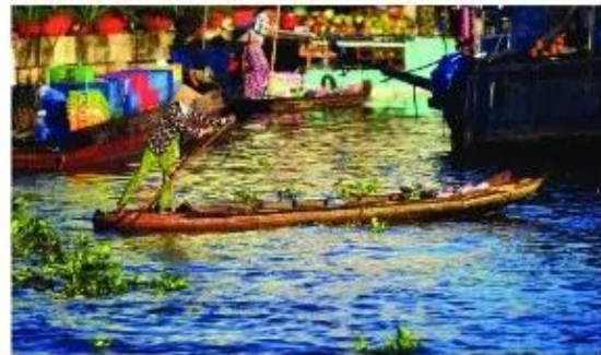
Đi chợ trên sông, Sóc Trăng

Cuộc sống xung quanh mở ra cho chúng ta rất nhiều ý tưởng có thể khai thác trong sáng tác mỹ thuật. Chính những hình ảnh của cuộc sống và tự nhiên đã tạo nên cảm hứng để thể hiện chủ đề mỹ thuật với những hình ảnh, màu sắc tươi mới theo ý thích của mình.