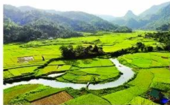
Cánh đồng lúa Lũng Cao, Thanh Hoá