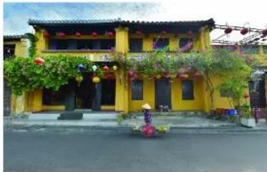
Phố cổ Hội An, Quảng Nam