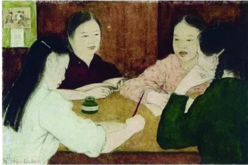
Học tổ , tranh lụa, Nguyễn Phan Chánh, 1959