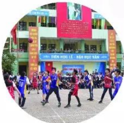
Chơi bóng rổ