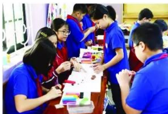
Học nhóm