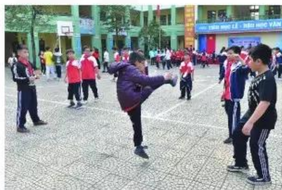
Đá cầu