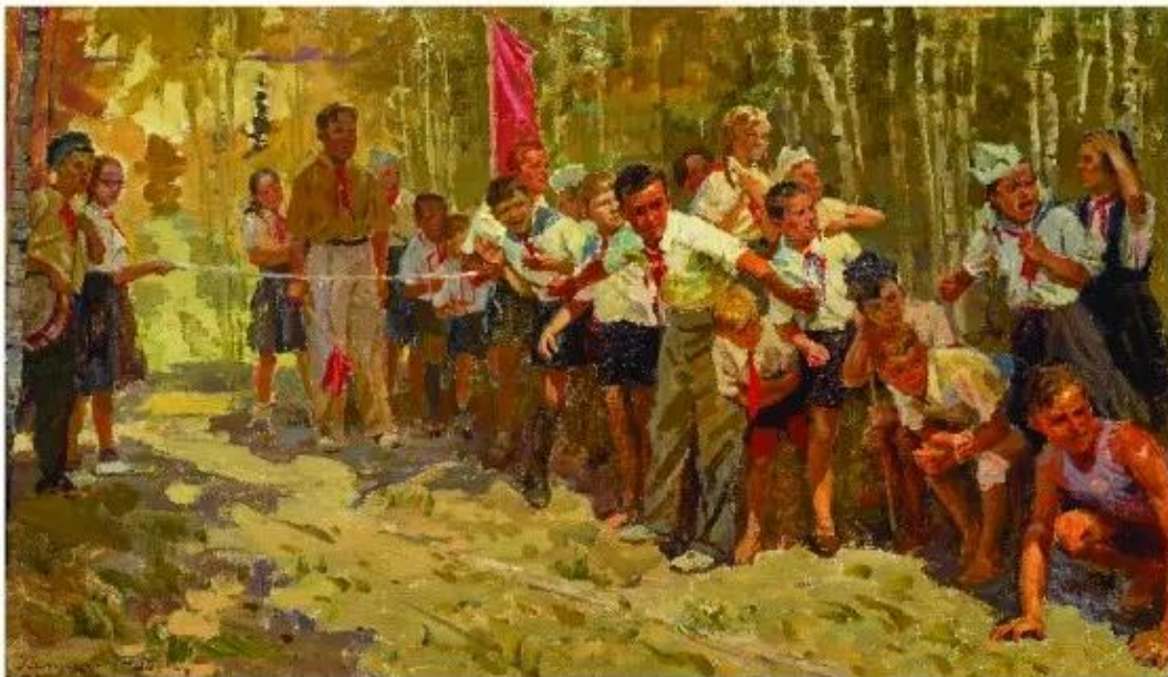
To the finish line (Về đích), tranh sơn dầu, Rostislav Nikolaevich Galitsky, 1950