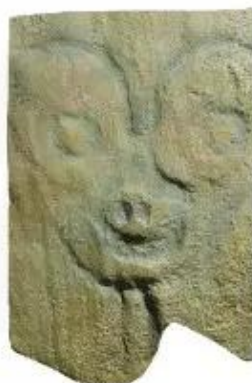
Hình khắc trên vách đá hang Đồng Nội (Lạc Thủy, Hoà Bình), văn hoá Hoà Bình