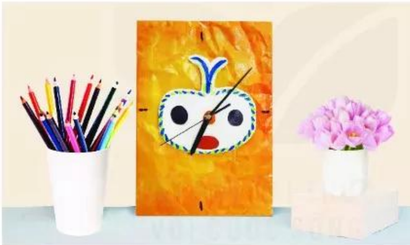
Đồng hồ sử dụng hoa văn hình khắc trên vách đá hang Đồng Nội, sản phẩm mỹ thuật đa chất liệu, Ngô Quang Tuyền

Trang trí góc học tập có sử dụng hình ảnh từ di sản mỹ thuật Việt Nam thời kì Tiền sử