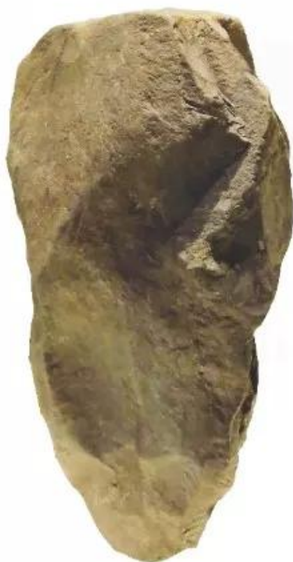
Rìu đá (Núi Đọ, Thiệu Hoá, Thanh Hoá), văn hoá Tràng An