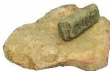
Chày và bàn nghiền đá (Chiềng Xén – Làng Vành, Hoà Bình), văn hoá Hoà Bình